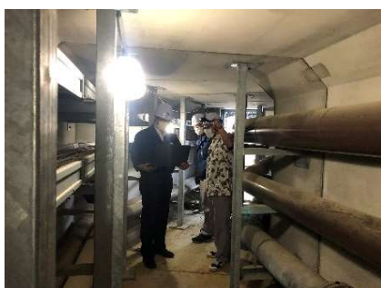
【スパリゾートハワイアンズ地下調査の様子】

本計画の概要をご説明した動画を、4 月 1 日（木）9 時から公式 YouTube にて配信いたします。