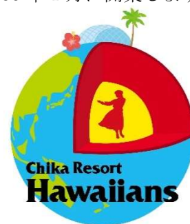
【チカリゾートハワイアンズロゴマーク】

スパリゾートハワイアンズの前身は、本州最大の炭鉱であった常磐炭礦ですが、エネルギーの主役が石炭から石油に変わり石炭産業が衰退したことで、業態変更を決意。地下から湧き出る豊富な常磐湯本の温泉水を活用し、「夢の島ハワイ」をイメージした日本初のテーマパーク「常磐ハワイアンセンター」（現スパリゾートハワイアンズ）を、1966 年 1 月に開業しました。